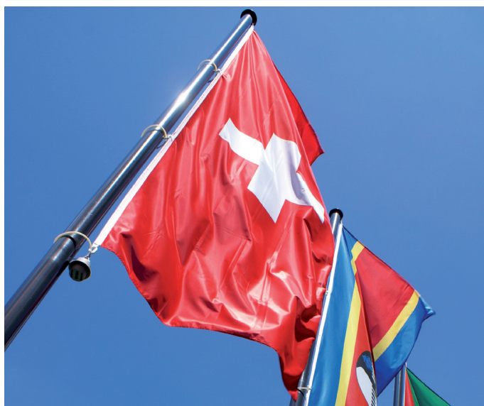
Asta a manovella

Asta a prova di furto per bandiere da issare. Grazie al dispositivo d'issaggio collocato internamente, quest'asta è particolarmente indicata per luoghi di passaggio come zone pedonali, edifici pubblici o vie dello shopping.