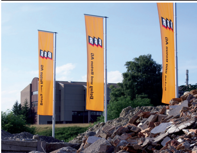
Kľukový stožiar s otočným ramenom